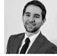
Av. Ali Tunçsav