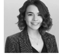
Av. Esen Çakır